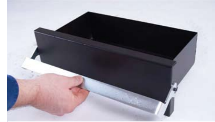
Einfache Handhabung der großzügigen Aschenlade