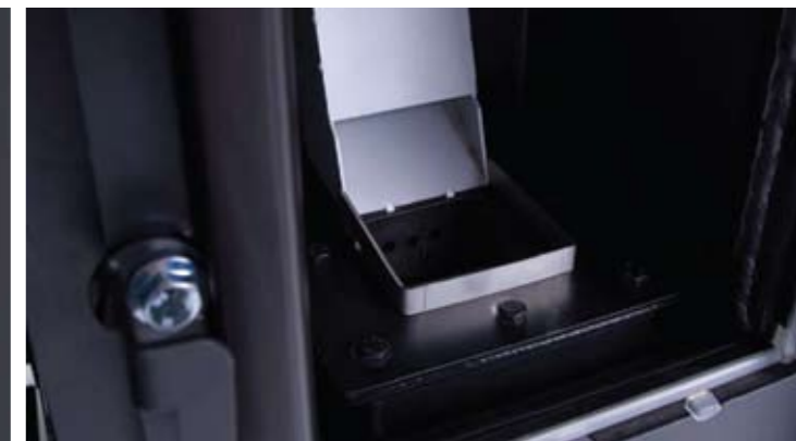
Hochhitzebeständiger, langlebiger Hochleistungsbrenner