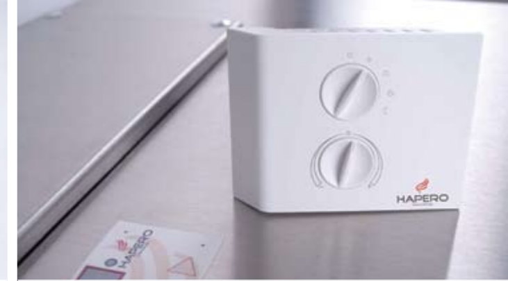
Komfortables, kabelloses Bedienungselement