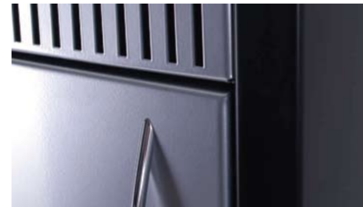
Edle Linien vollenden das anspruchsvolle Design

Heute ist Energieeffizienz gefragt, um die Zukunft zu sichern. Dabei spielt eine ausgereifte Systemtechnik die entscheidende Rolle. Über hochwertige Einzelkomponenten, die Reduzierung von Wärmeverlusten und hochmoderne Regelungstechnik können wir fast vollständig vermeiden, dass einmal bezahlte Wärmeenergie ungenutzt entweicht.