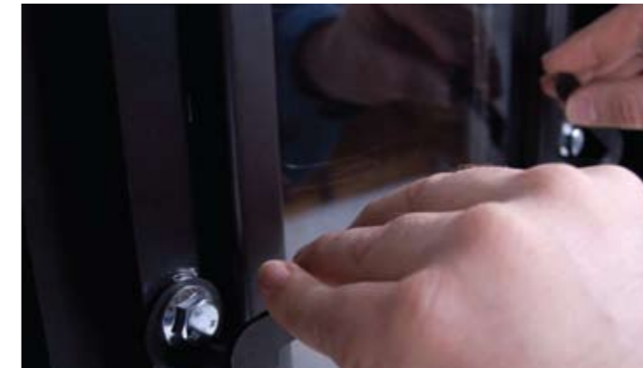
Patentiertes Schnellwechselsystem für die Sichtfenster